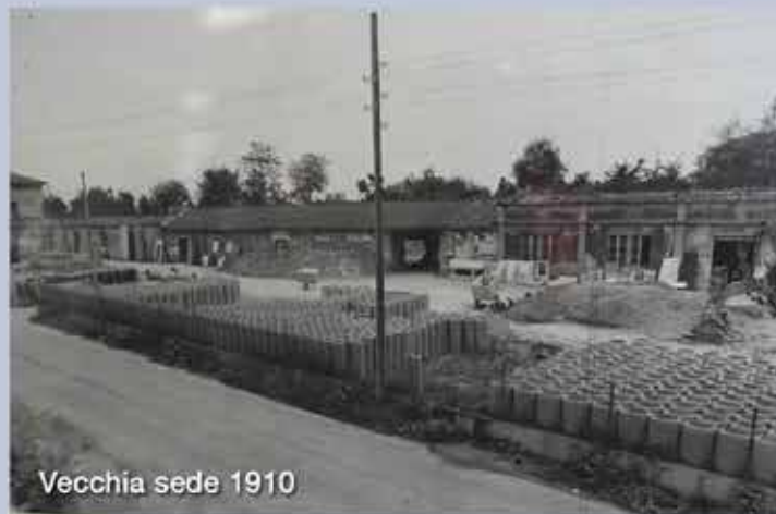
Vecchia sede 1910